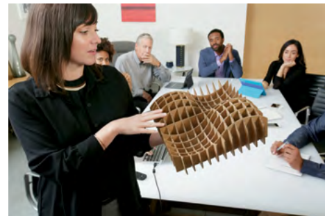
특정 물체 혹은 화이트보드 내용에 대한 근접촬영의 경우, 로지텍 그룹(GROUP)의 카메라는 뛰어난 해상도로 선명하게 모든 세부적인 부분을 볼 수 있도록 10x 무손실 줌 기능을 지원합니다.

여러가지 카메라 마운팅 옵션을 통해 회의실 공간을 원하는대로 설정할 수 있습니다. 테이블에 카메라를 올려놓거나 본체와 함께 벽에 설치하여 사용해 보십시오. 카메라의 밑 부분은 다양하게 이용할 수 있도록 표준 삼각대 연결을 지원합니다. 회의 참가자들은 베이스 반경 6미터 내에서 또렷한 음성으로 회의를 진행할 수 있으며 확장 마이크(옵션)를 통하여 범위를 8.5미터까지 확장할 수 있습니다.